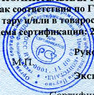
Схема сертификации: 2.

Знак соответствия по ГОСТ Р 50460 с надписью «Добровольная сертификация» наносится на тару и/или в товаросопроводительную документацию.