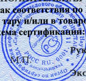
Схема сертификации: 2.

Знак соответствия по ГОСТ Р 50460 с надписью «Добровольная сертификация» наносится на тару и/или в товаросопроводительную документацию.